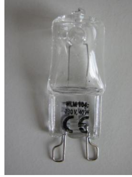
Abb. 3: Halogenlampe mit Sockel G9