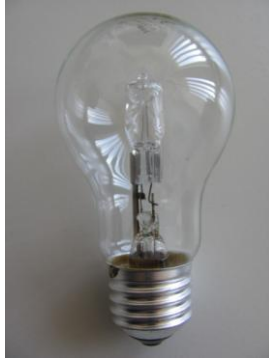
Abb. 2: Halogenlampe mit Sockel E27