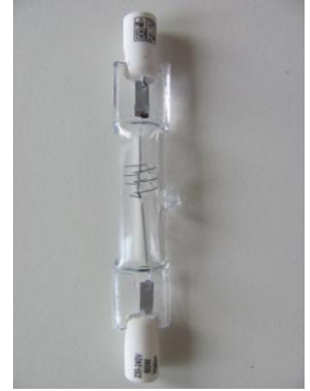
Abb. 4: Halogenlampe mit Sockel R7s

Bei 16 der 20 Prüfmuster war der Mittelwert des gemessenen Lichtstroms kleiner als 90% des auf der Lampenverpackung angegebenen Wertes, bei 7 Lampen war der Mittelwert sogar <80%. Erlaubt ist eine maximale Abweichung von 10%.