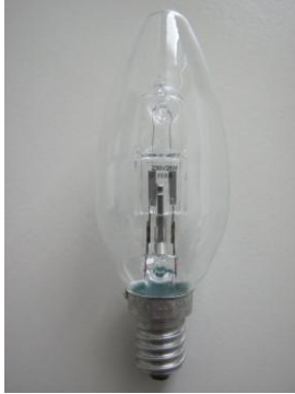
Abb. 1: Halogenlampe mit Sockel E14