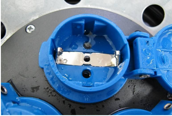
Abb. 1: Wasser drang trotz geschlossenem Deckel in die Steckdose ein