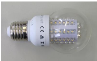
Abb. 1 LED-Kerze

LED-Kerzen mit einem Abstrahlungswinkel von mehr als 180° haben auch die Anforderungen der EU-Verordnung 244/2009 zu den Energiesparanforderungen an Haushaltslampen zu erfüllen. Bei vier von 10 solcher Prüfmuster (40%) zeigte sich, dass Informationen zu Leistungseigenschaften und zum Energieverbrauch für die Verbraucher nicht frei zugänglich gemacht wurden.