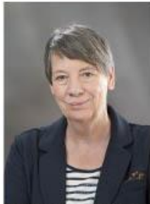
Bundesministerin Barbara Hendricks