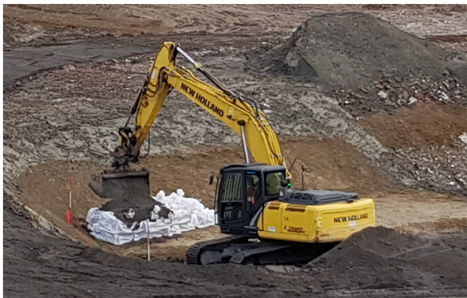
Abbildung 1: Einbau von 20 zur Beseitigung auf einer Deponie freigegebenen Betonblöcken aus dem Kernkraftwerk Obrigheim in die Deponie Sansenhecken des Neckar-Odenwald-Kreises. (Quelle: UM)

verplombt. Nach den positiven Rückmeldungen der Sachverständigen und der Übersendung der Chargendokumentation an die Deponie gemäß der Handlungsanleitung stimmte das UM der Beseitigung der Charge zu. Am 11.12.2018 wurde die Charge im Beisein von Vertretenden der Deponie, des UM sowie des Sachverständigen des UM aus dem Lager-Container in einen LKW verladen und dieser ebenfalls verplombt. Am darauffolgenden Tag erfolgte die Anlieferung und der Einbau der Betonblöcke in die Deponie Sansenhecken.