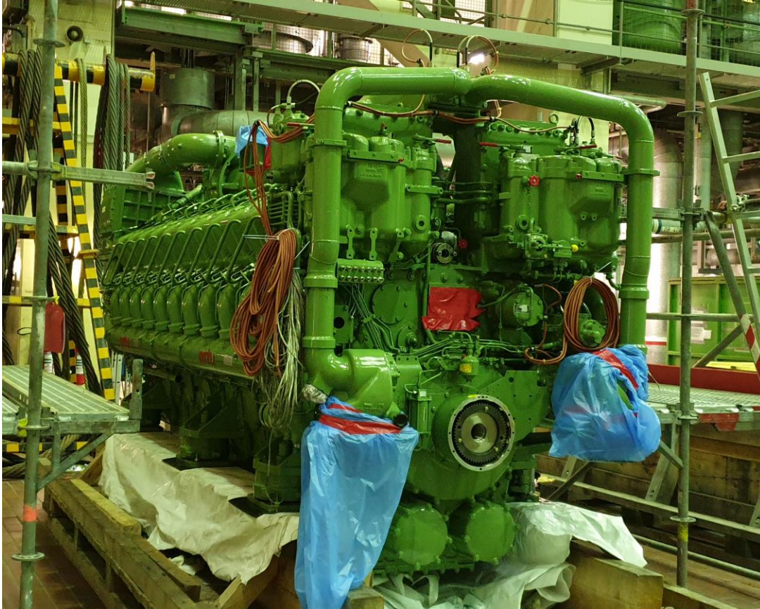
Abb. 2: ausgebautes Notstromdieselaggregat XJA20

Außerdem ist der Betreiber verpflichtet, bei Schäden oder Ausfällen von Komponenten zu prüfen, ob ein Fehler auch zu einem Schaden bzw. Ausfall vergleichbarer Komponenten führen könnte. Solche Fälle werden als „systematischer Fehler“ bezeichnet.