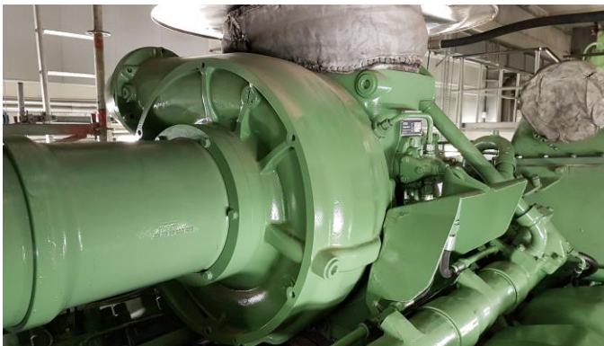
Abb. 3: Beispiel Abgasturbolader

Am 10.04.2018 wurde am Abgasturbolader des Notstromdieselmotors 10 eine interne Kühlwasserleckage festgestellt. Die nachfolgenden Untersuchungen haben gezeigt, dass die Kühlwasserleckage durch einen Riss im Gehäuse des Abgasturboladers verursacht wurde, der vermutlich durch wechselnde Temperaturbeanspruchungen entstanden ist. Bezüglich der Ursache dieses Ereignisses liegt der Aufsichtsbehörde noch kein abschließender Untersuchungsbericht der Materialuntersuchung des Gehäuses vor.