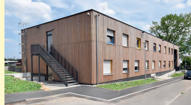
Rechte: Archiplan Architekten GmbH, Böblingen

Die Veranstaltung wird für die Energieeffizienz-Expertenliste für Förderprogramme des Bundes mit 3 Unterrichtseinheiten (Wohngebäude), 3 Unterrichtseinheiten (Energieberatung im Mittelstand), 4 Unterrichtseinheiten (Nichtwohngebäude) angerechnet.