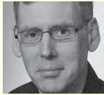
Ingo Pelchen hartwig schneider architekten Stuttgart