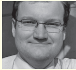
Klaus Teizer Vollack Gruppe GmbH & Co. KG