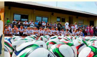
Sanierung des Vereinsheims beim SV Germania Bietigheim