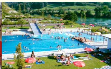
Neue Warmwasserbereitung und Nahwärme im Freibad Laufenburg