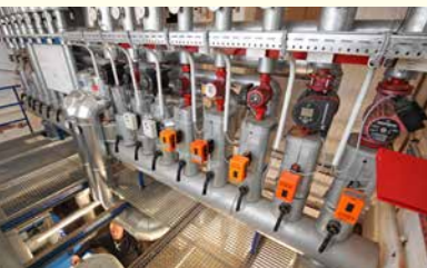
Erneuerung der Heizzentrale in der Grundschule Vöhrenbach