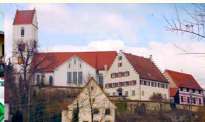
Einbau einer Holzpelletheizung für kirchliche Gebäude in Bingen