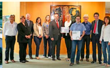
LED-Beleuchtung im Landratsamt des Ostalbkreises in Aalen