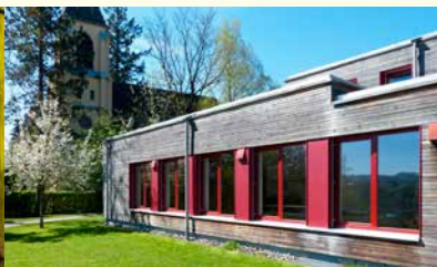
Wärmeschutzmaßnahmen am ev. Gemeindezentrum Bad Waldsee