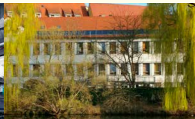
Thermische Solaranlage auf einem Altenpflegeheim in Rottenburg a.N.