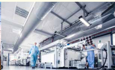
Sanierung der Lüftungsanlage beim Autozulieferer NAP in Pforzheim