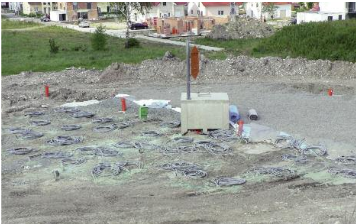
Bau eines Erdsondenwärmespeichers