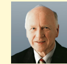
DR. ERWIN VETTER Erster Umweltminister des Landes Baden-Württemberg