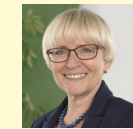
DR. BRIGITTE DAHLBENDER Landesvorsitzende des Bundes für Umwelt und Naturschutz Deutschland (BUND)