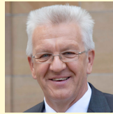
ERFOLGE UND HERAUSFORDERUNGEN DEUTSCHER UMWELTPOLITIK Ministerpräsident Winfried Kretschmann MdL