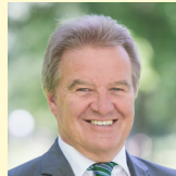
UNTERWEGS IN SACHEN ZUKUNFT – DREI JAHRZEHNTE UMWELTMINISTERIUM BADEN-WÜRTTEMBERG Umweltminister Franz Untersteller MdL